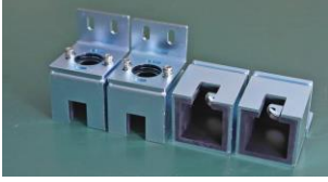
RPZ上下取付金具(ハットLG型) 品目コード: JMRPZ-JYOGELG