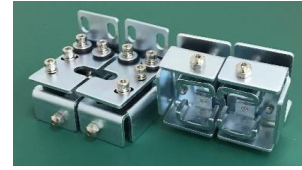
RPZ上下取付金具 側面 品目コード: JMRPZ-JYOGE2-SOKU