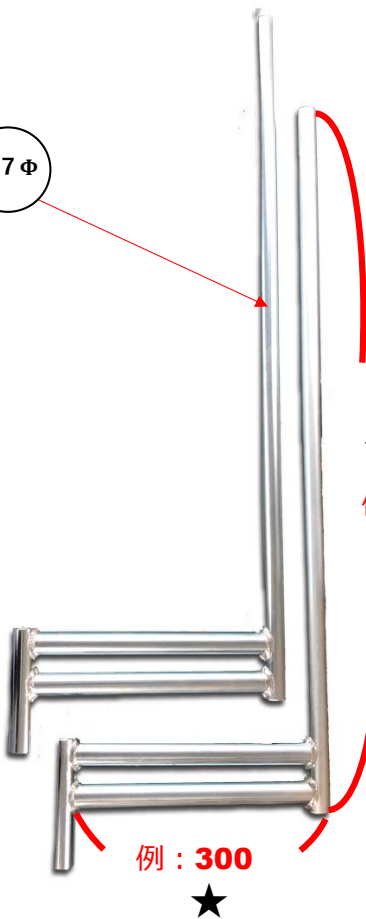
ポール型取付金具 ラインアップ表