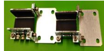
補助光用背面取付金具 (XZ共) 品目コード: JMRP-H-TYUKAN