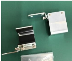
平板付中間金具(側面) 品目コード: JMRP-TYUKAN-SID