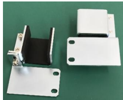
中間取付金具(11L1701R2) 品目コード: JMRPX-TYUKAN