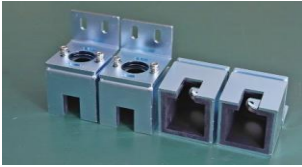
RPZ上下取付金具(ハットLG型) 品目コード: JMRPZ-JYOGELG